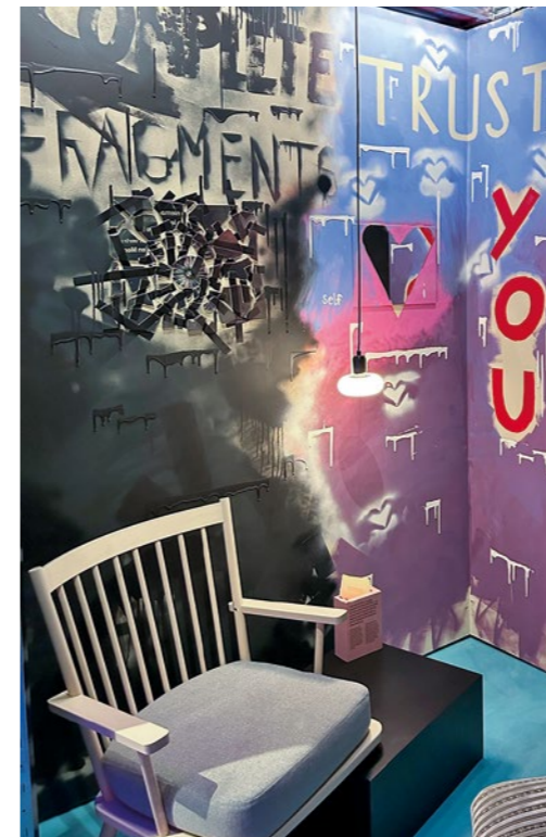
Hauptsache gesund., 2025

Klinische Kunsttherapie, wie sie in den PDAG vertreten und angewendet wird, ermöglicht es, den Patient:innen innere Bilder, Gefühle und Konflikte sichtbar zu machen und eigene Perspektiven zu entwickeln. Diese Form der Äusserung ist besonders wertvoll, wenn sprachliche Ausdrucksmöglichkeiten nicht ausreichen, um komplexe emotionale Zustände mitzuteilen. Wir verstehen Kunsttherapie in ihren vielfältigen Kompetenzen und reduzieren uns deshalb nicht auf einzelne Methoden. Dies ermöglicht, auf individuelle Bedürfnisse unterschiedlicher Patient:innengruppen einzugehen. Gleichermassen werden wirksame Kriseninterventionen angeboten und lange psychotherapeutische Prozesse begleitet. Durch die Arbeit mit verschiedenen Materialien und Medien wie Malen, Plastizieren oder Fotografieren wird das Wahr-