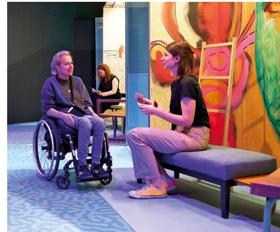
Hauptsache gesund., 2025

nehmungsvermögen aktiviert. Das fördert nicht nur die sensorischen und motorischen Fähigkeiten und die sozial-kommunikative Kompetenz, sondern auch die Selbstregulation und Mentalisierungsfähigkeit. Diese Prozesse erfordern eine professionelle Begleitung. In der therapeutischen Beziehung und durch die materielle Präsenz der geschaffenen Werke entsteht ein Raum für Reflexion. Dieser Raum unterstützt die Patient:innen dabei, ihre Selbstwirksamkeit und Identität zu stärken.