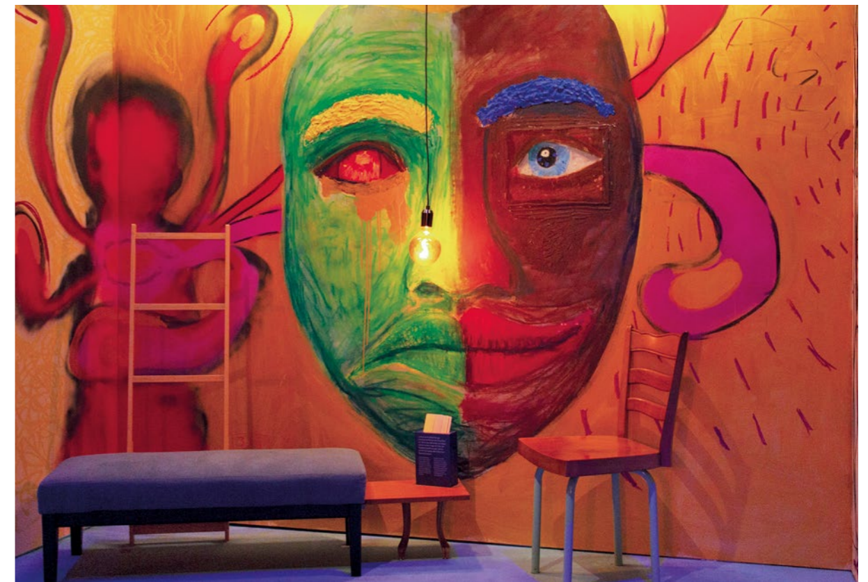
Hauptsache gesund., 2025

anregung und eröffnen den Austausch auf spielerische Weise. Der Raum lädt zum Verweilen ein und zur Reflexion mit sich selbst und seinem Gegenüber.