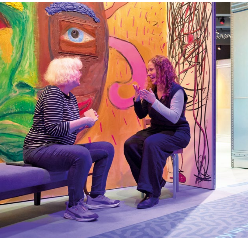
Hauptsache gesund., 2025